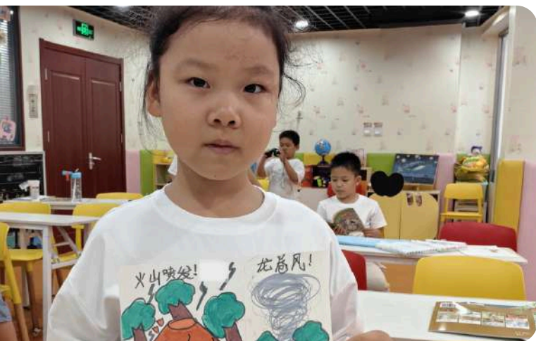
为提升社区儿童及家庭的灾害预防意识，项目开展了“童心绘安全·防灾伴成长”防灾漫画创作活动。

通过调动本土力量，融入科技与创新，且重视儿童的参与，项目在提升本地社会组织及社区的能力、保护脆弱人群、提升社区复原力三方面取得了显著效果。