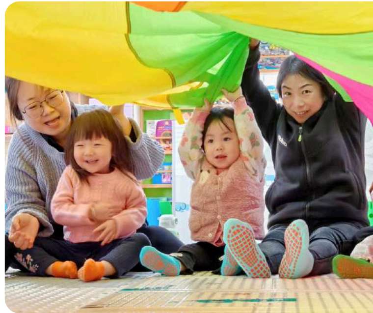
亲子在儿童活动中心一同玩耍，既增进亲子关系也促进幼儿发展。

在与伙伴的合作努力之下，我们 通过巩固儿童保护服务体系、开展早期养育和学前教育项目、开展残障融合项目、提升社区灾害预防能力、增加农村地区安全用水设施设备、减少儿童非故意伤害 ，全年共 服务197,898名儿童及其家人 。