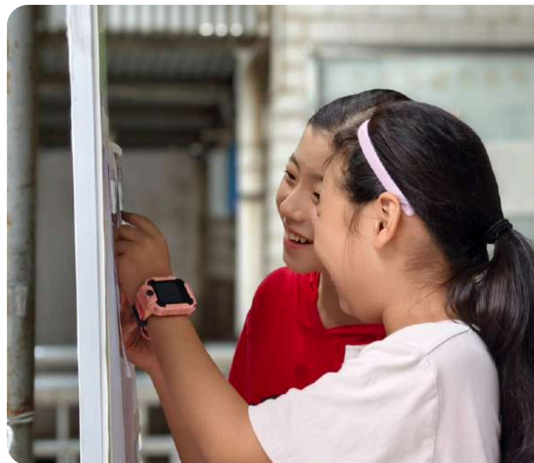
在社区游园会当中，儿童既是游玩者，也是摊主、裁判等组织者。