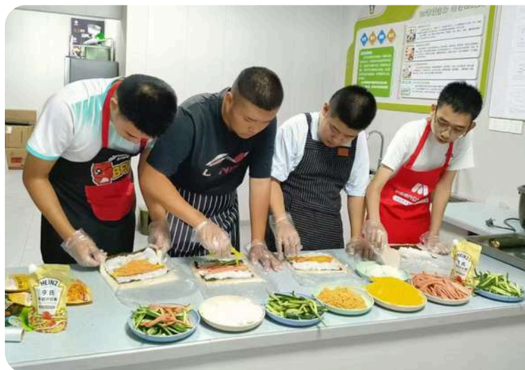
项目开展职业教育及素养培训，让残障青年了解更多职业，以探寻自己的职业方向，更好地步入社会。