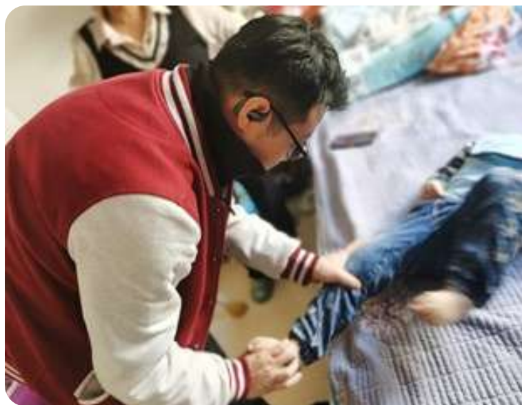
康复治疗师上门为农村的残障儿童提供评估、康复训练、生活自理能力培养等方面的支持。

今年，项目共组建14个自治小组，支持173名残障青少年参与小组的日常管理，并鼓励青少年勇于为与自己相关的事项做决策，并尝试学会互助及共融。